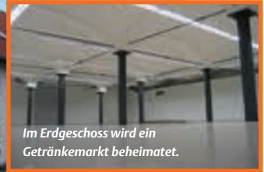
Im Erdgeschoss wird ein Getränkemarkt beheimatet.

Wo früher Ackerbau und Viehzucht im Mittelpunkt standen, fanden jetzt Familien, Büros und sogar ein Getränkemarkt ein neues Zuhause. Die Ingenieurbauer von Wayss & Freytag Ingenieurbau, Bereich Süd machten dies in München möglich, denn sie sanierten ein denkmalgeschütztes Bauernhaus aus dem 18. Jahrhundert. Die Arbeiten wurden in enger Abstimmung mit der Denkmalschutzbehörde geplant und ausgeführt. Dazu gehörte auch die spätere Ausführung aller Details wie zum Beispiel die Gestaltung der Fenster und Fensterläden. Denn es galt, den ursprünglichen Charakter des Kleinod zu erhalten. Doch bevor das Team um Projektleiter Stefan Götz loslegen konnte, untersuchten Archäologen ausgiebig den Boden des Grundstücks, da sich hier auch ein Bodendenkmal befindet. Die