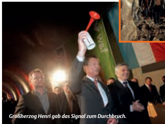
Großherzog Henri gab das Signal zum Durchbruch.