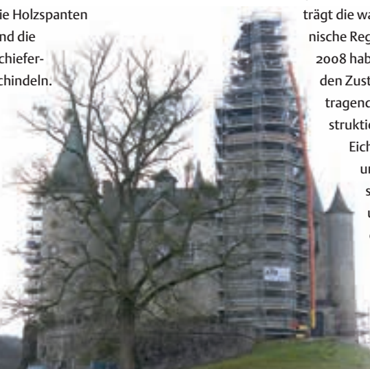
Die Burg von Vêves.